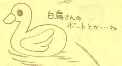
白鳥さんのボートとか...ね

お米をつぶしたものを杉の木の串につけて、甘い味噌をぬって炭火であぶったもので、まあ田舎流ファーストフードといったところでしょうか? 香ばしくてオイシイよ♡