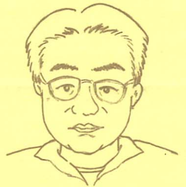
ミツバチ 2代目 ファミリー ブン太

オシイはちみつがいっぱい採れるように一生懸命がんばります。よろしく願っています 新・ブン太